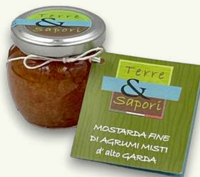
Fine di Agrumi Misti Vasetto in vetro gr. 110