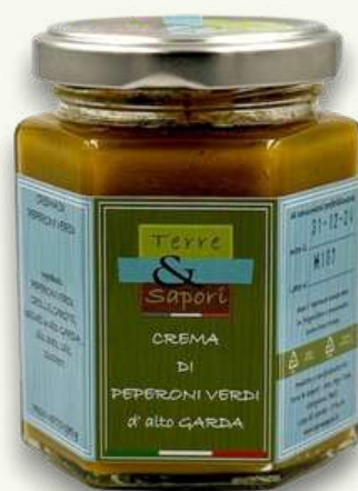
Crema di Peperoni Verdi Vasetto in vetro gr. 180