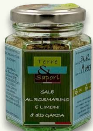
Sale al Rosmarino e Limoni Vasetto in vetro gr. 80