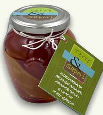
Arance Amare e Dolci Vasetto in vetro gr. 400