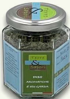
Erbe Aromatiche Miste Vasetto gr. 30