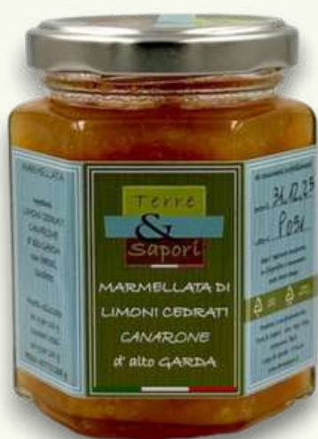
Limoni Cedrati Canarone