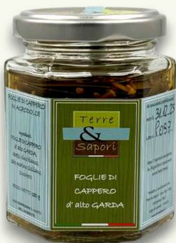
Foglie di Cappero Vasetto in vetro gr. 180