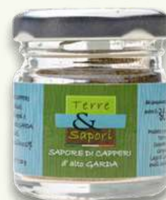
Sapore di Capperi Vasetto in vetro gr. 20

La linea dei capperi è preziosa e prodotta in quantità limitata. La loro disponibilità è legata agli andamenti stagionali in agricoltura e in natura.