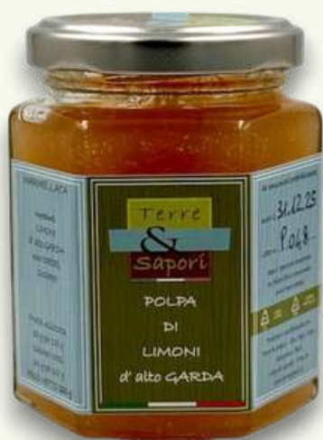
Polpa di Limoni