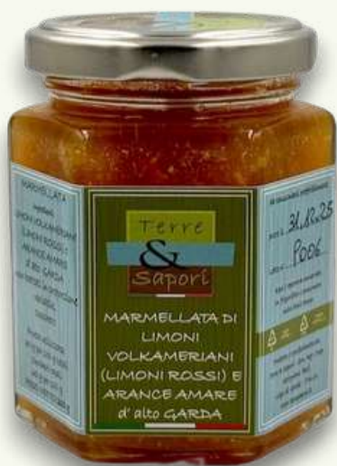
Limoni Volkameriani e Arance Amare