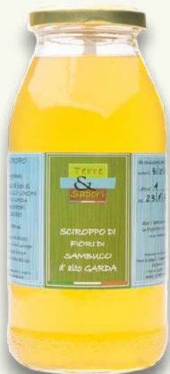
Fiori di Sambuco

I nostri sciroppi sono disponibili in bottiglie di vetro da 500 ml.