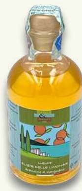
Arancino Bottiglia ml 100