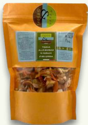
Tisana alle Scorze di Agrumi Sacchetto gr. 100

Completano il nostro catalogo delle foglie essiccate di olivo e di alloro per infusi, tisane a base di erbe aromatiche e agrumi, oltre allo zafferano del Montegargnano.