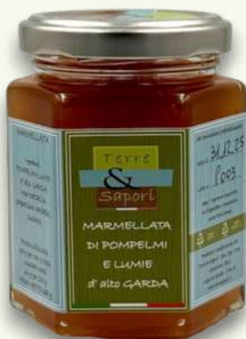
Pompelmi e Lumie