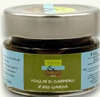
Foglie di Cappero Vasetto in vetro gr. 125