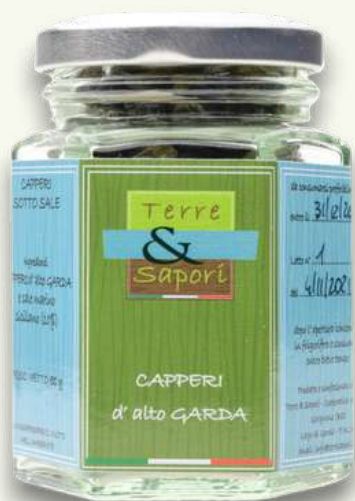
Capperi Vasetto in vetro gr. 50