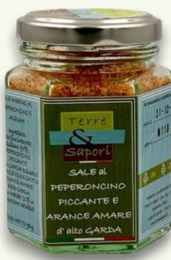
Sale al Peperoncino e Arance Amare Vasetto in vetro gr. 90