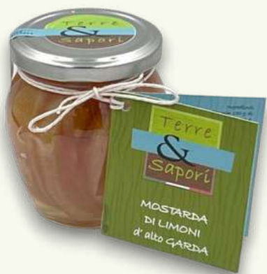
Limoni Vasetto in vetro gr. 250