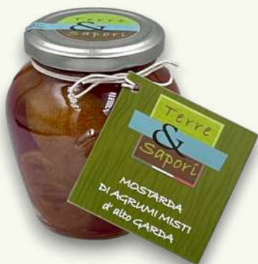
Agrumi Misti Vasetto in vetro gr. 400

Abbinatele ai formaggi o ai bolliti ed avrete un connubio armonioso ed esaltante.