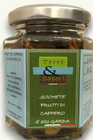
Frutti di Cappero Vasetto in vetro gr. 130