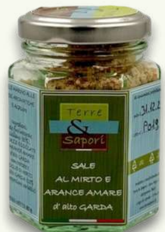
Sale al Mirto e Arance Amare Vasetto in vetro gr. 80