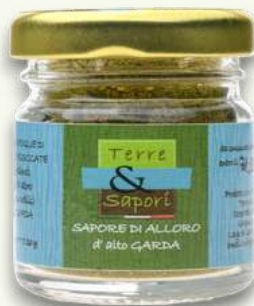
Sapore di Alloro Vasetto gr. 20