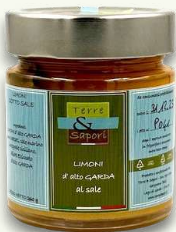
Limoni al Sale Vasetto in vetro gr. 260

Produciamo anche composte da orticole conferite dai soci per ottenere creme spalmabili o composte da utilizzare per gli aperitivi o in abbinamento ad altre pietanze.